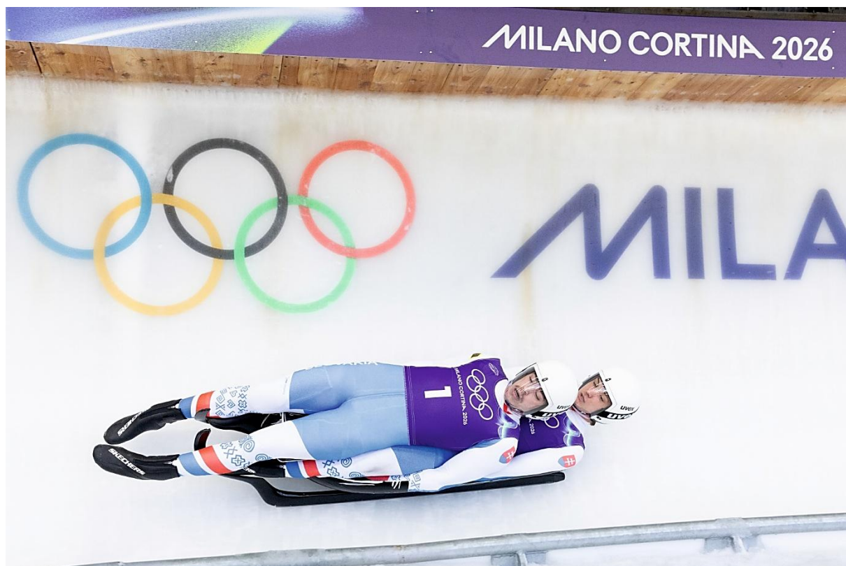
ZOH Cortina – Bosman/Mick