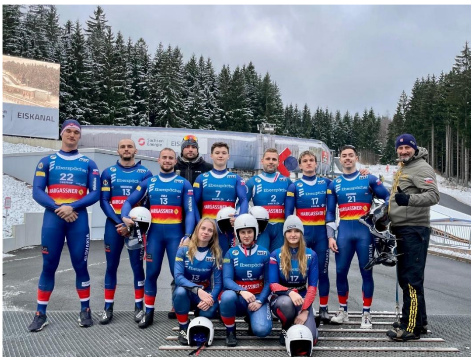
VT Sigulda – sústredenie reprezentácie